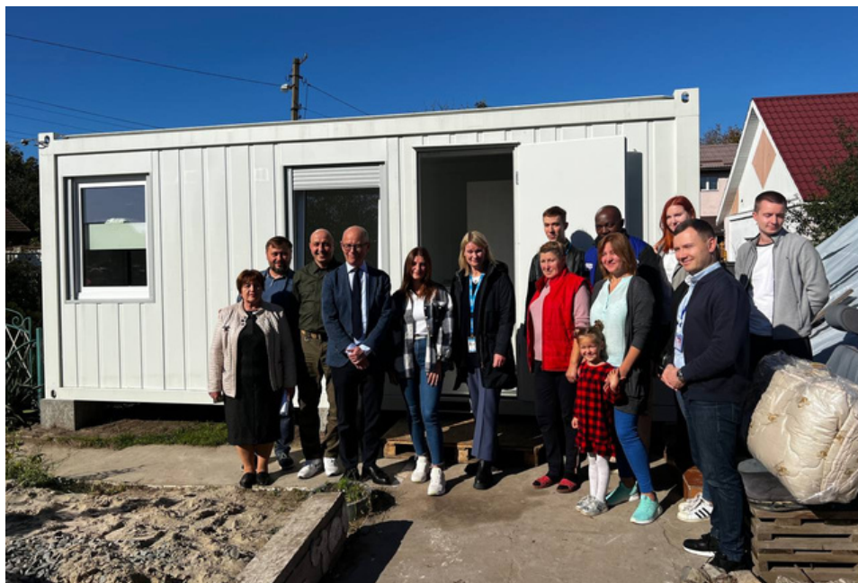
Przekazanie domów modułowych w mieście Buzova, fot. PAH, 2022