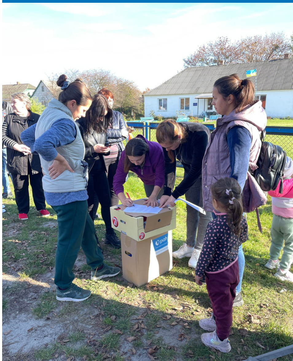
Dystrybucja żywności w obwodzie wołyńskim

Do tej pory zapewniliśmy 123 677 pakietów żywnościowych, 44 974 pakietów higienicznych. W sumie dotarliśmy z tego pomocą do 287 553 osób.