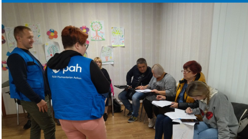
Wizyta mobilnej grupy psychologów w mieście Żółte Wody, fot. PAH, 2022

W pierwszych spotkaniach wzięło udział ponad 300 osób - kobiet i mężczyzn. Docelowo ta pomoc ma dotrzeć do 1500 ludzi w obwodzie dniepropietrowskim.